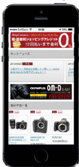
カメラ専門サイト 「マップカメラ」