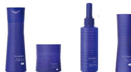
<プラーミア 新アイテム>