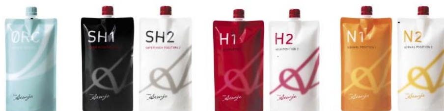
<リシオアテンジェ ストレート剤シリーズ>