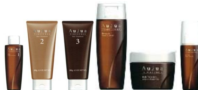
<タイムサージライン>