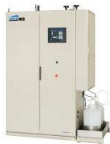
クレベリン発生機 リスパス NEO