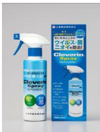
クレベリン スプレー