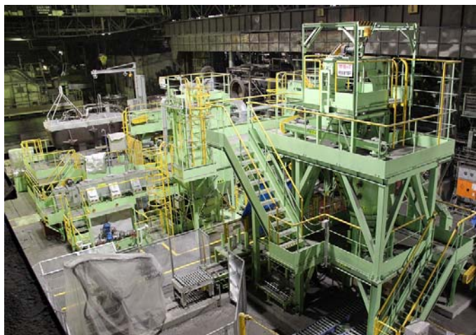
「ASショット」量産設備