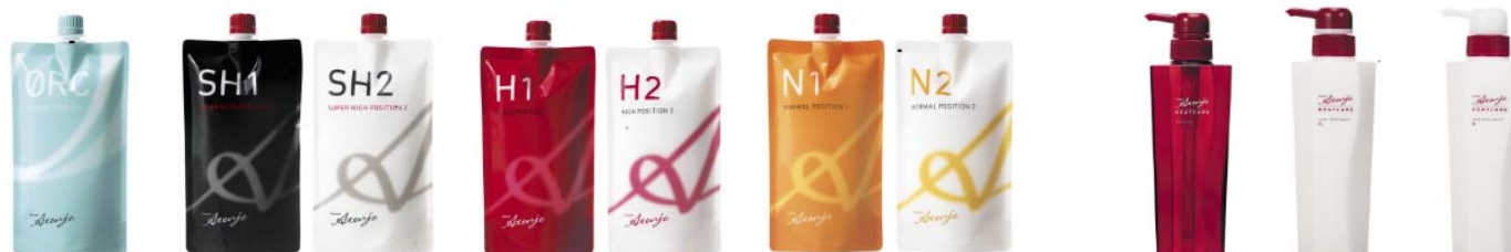
<リシオアテンジェ ストレート剤シリーズ>