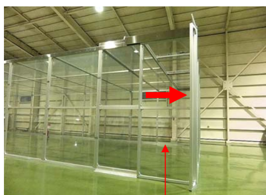
スライドスクリーン フルシャット時 【作業休止時 (スリープモード時)】