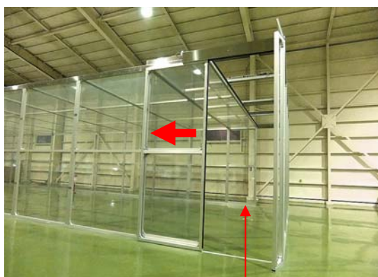
スライドスクリーン オープン時 【作業時】