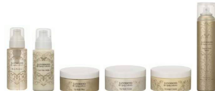
<ルビエント アップスタイリングコレクション>