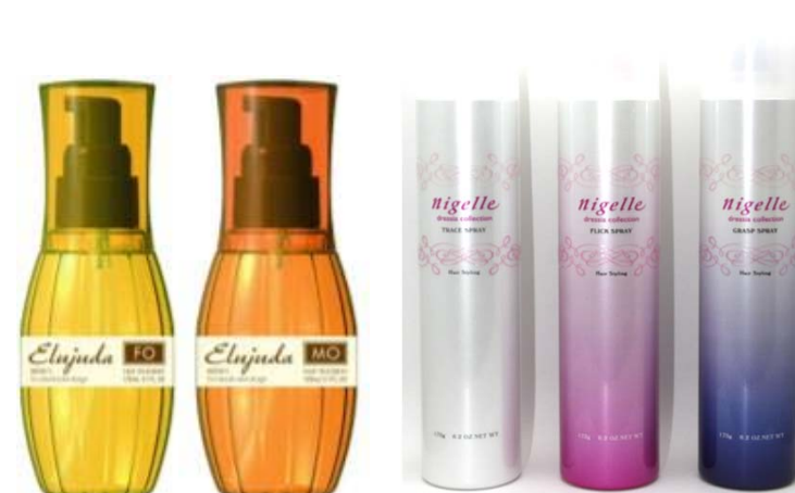
<ディーセス エルジュータ> <ニゼルドレシアコレクション スプレーシリーズ>