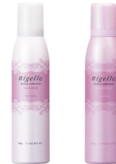
<ニゼル ドレシアコレクション フォームシリーズ>