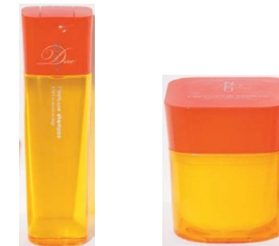
<ディーセス ノイ ドゥーエ フレッシュリユクス>