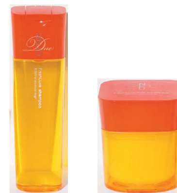
<ディーセス ノイ ドゥーエ フレッシュリユクス>