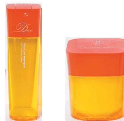
<ディーセス ノイ ドゥーエ フレッシュリユクス>