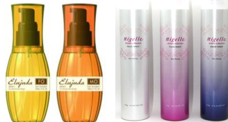
＜ディーセス エルジュータ＞ ＜ニゼルドレシアコレクション スプレーシリーズ＞