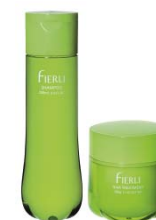
4月1日発売 くせ毛対応ヘアケア剤<フィエーリ>