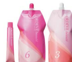
<オルディーブ ボーテ>