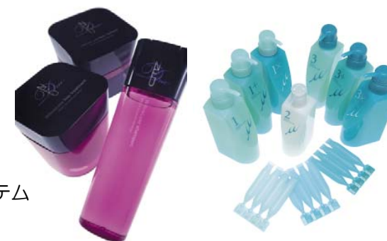
<ディーセス ノイ ドゥーエ> <リンケージ ミュー>