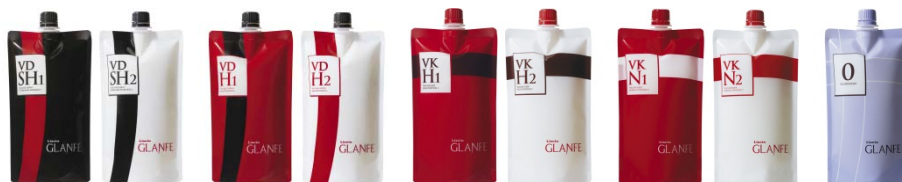
主力製品<リシオ グランフェ>