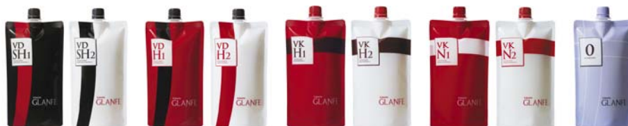
主力製品<リシオ グランフェ>