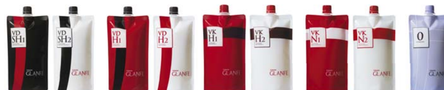
〈リシオ グランフェ〉