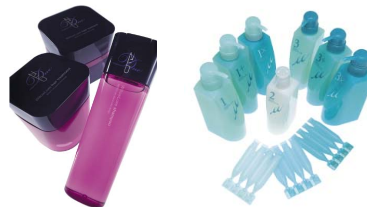
<ディーセス ノイ ドゥーエ> <ディーセス リンケージ ミュー>